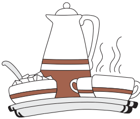
Senioren-Frühstück mit Vorträgen